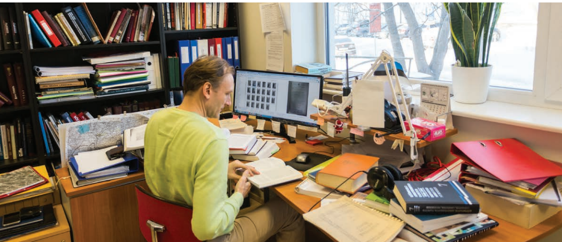
Eesti Mälu Instituudi teadur tööpostil. An Estonian Institute of Historical Memory research fellow at work.