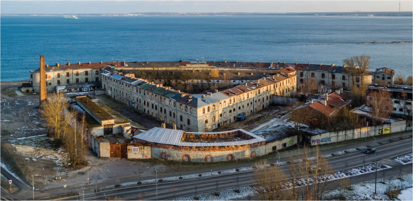
Patarei vangla linnulennult. Aerial view of Patarei Prison.

Muuseum rajatakse Patarei vanglakompleksi idatiiba ligi 5000 ruutmeetrile, kus on säilinud vangikongid, mahalaskmisruum, koridorid, vanglahoov koos vangide jalutusruumidega ja palju muud vaatamisväärsed. Hoonet kasutas alates 1920. aastast kinnipidamisasutusena esmalt Eesti Vabariik ning seejärel okupantidena Eestis tegutsenud Nõukogude Liidu (1940–1941, 1944–1991) ja natsionaalsotsialistliku Saksamaa (1941–1944) julgeolekuasutused.