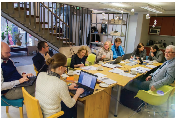
Rahvusvaheliste partnerite töökoosolek Tallinnas. Working meeting of international partners in Tallinn.