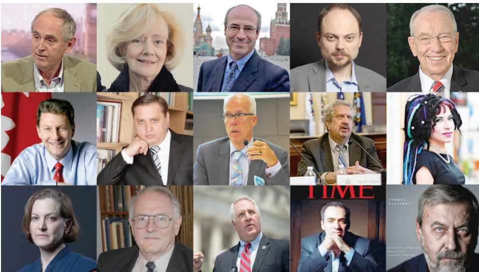
Rahvusvahelise Kommunismiohvrite Mälestusmuuseumi ja teaduskeskuse algatuse toetajad. Supporters of the initiative for the International Museum of Remembrance of Victims of Communism and research centre.