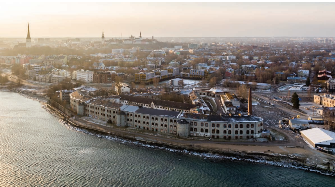
Patarei vangla linnulennult. Aerial view of Patarei Prison.

The Patarei complex is one of Europe's largest completely preserved military structures in classicist style. The European cultural heritage preservation organisation Europa Nostra and the European Investment Bank Institute have listed the Patarei naval fortress among Europe's most endangered monuments. We are pleased to be able to contribute to the restoration of the building and opening it to the public!