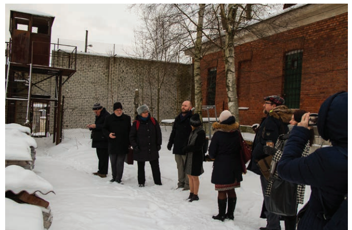
Rahvusvahelised partnerid tutvuvad Patarei vanglaga. International partners acquaint themselves with Patarei Prison.