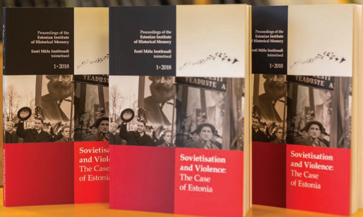
Eesti Mälu Instituudi toimetised I (2018). Proceedings of the Estonian Institute of Historical Memory 1 (2018).