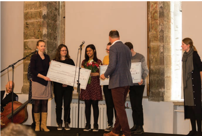
Muuseumi ideekonkursi tööde autorite auhindamine. Awarding of the authors of the museum design competition entries.

On 11 April , the entries to the Patarei International Museum for The Victims of Communism design competition were presented, and the best were awarded at the Blackheads House in Tallinn. The results of the competition can be considered the first professional architectural vision focusing on the future of Patarei. The Japanese architect Shuhei Endo earned first place with his entry Red Erosion.