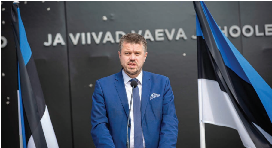
Kõneleb justiitsminister Urmas Reinsalu. Urmas Reinsalu, Estonian Minister of Justice

Estonian Minister of Justice Urmas Reinsalu.