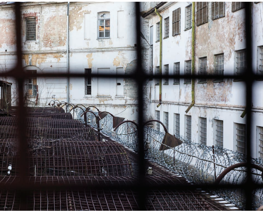
Patarei sisehoov. The Patarei inner courtyard.