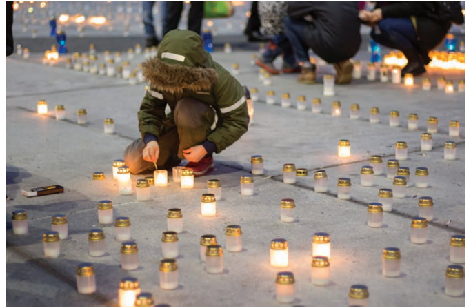
Küünalde süütamine Vabaduse väljakul. Lighting candles at Vabaduse väljak (Liberty Square).

11. aprillil esitleti Tallinnas, Mustpeade majas Patarei Rahvusvahelise Kommunismiohvrite Mälestusmuuseumi ideekonkursi töid ja autasustati parimaid. Konkursi tulemusi võib pidada esimeseks professionaalseks Patarei tulevikule keskenduvaks arhitektuuriliseks visiooniks. Esimese koha pälvis Jaapani arhitekt Shuhei Endo teosega “Red Erosion”.