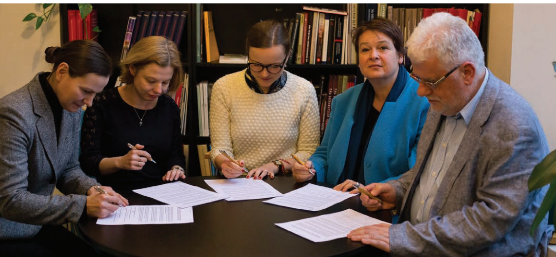
Eesti, Läti, Leedu, Poola ja Saksamaa mäluasutuste esindajad allkirjastavad Tallinnas 14.02.2018 koostööleppe. Representatives of memory institutions of Estonia, Latvia, Lithuania, Poland and Germany sign a cooperation agreement in Tallinn on 14 February 2018.

Several working meetings have been held with the main partners of the International Museum for The Victims of Communism, where a partnership agreement was signed and the main contours of the future exposition were sketched out.