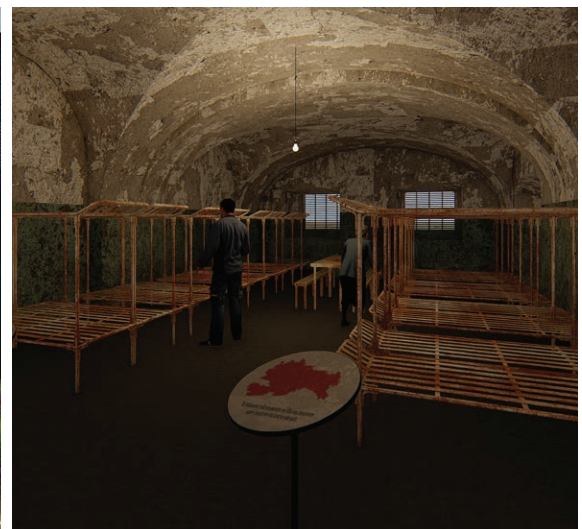
Ideekonkursi 3. koht, rahvalemmik. 3 rd place in the design competition, the public's favourite. Part of the winning entry of the design competition. Autor / Author: KOKO Architects, Eesti / Estonia