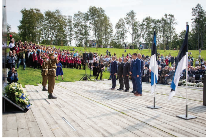
Kommunismiohvreid mälestasid pärja asetamisega Eesti, Läti, Leedu, Rumeenia ja Horvaatia justiitsministrid. The Ministers of Justice of Estonia, Latvia, Lithuania, Romania and Croatia commemorated the victims of communism by laying a wreath.

Memoriaal peab elama ja kõnetama – seepärast korraldame seal mälestuspäevadel koostöös riigiasutuste ja organisatsioonidega mälestusüritusi. Kasvatame huvi käsitada mälestuspaika kui hariduslikku, aga eelkõige kui moraalselt väärtust kandvat kohta, mille abil paremini teadvustada Eesti minevikukogemust.