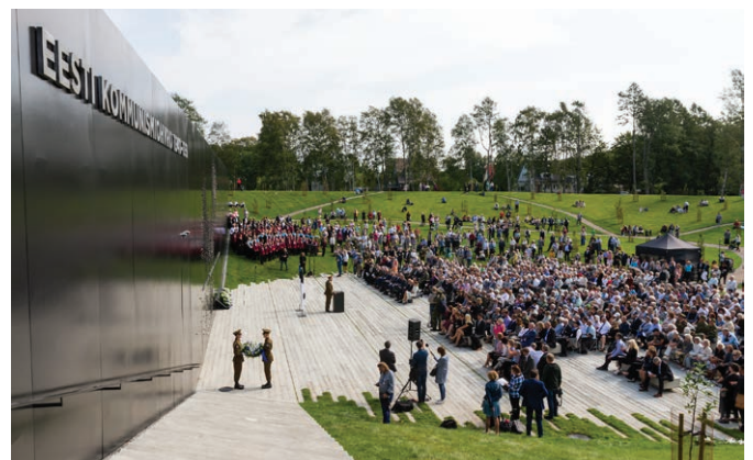
Hetk memoriaali avamistseremooniast. A moment from the Memorial's inauguration ceremony.

The Republic of Estonia financed the completion of the Memorial, and the Estonian Ministry of Justice coordinated it. The Estonian Institute of Historical Memory organised the inauguration ceremony in cooperation with the Estonian Ministry of Justice and the 100 th Anniversary of the Estonian organising team.