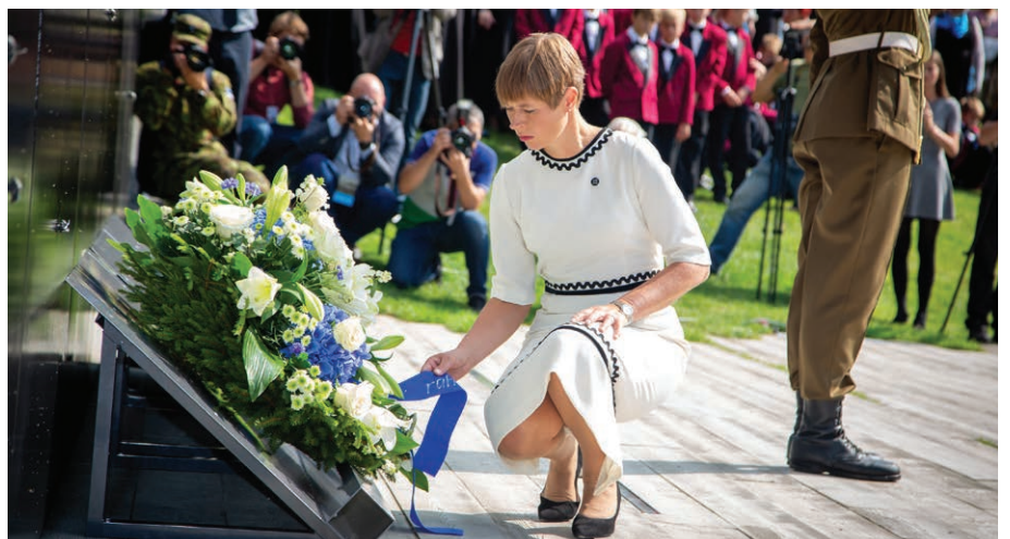
Vabariigi president Kersti Kaljulaid asetab pärja kommunismiohvritele. Kersti Kaljulaid, the President of the Republic of Estonia, lays a wreath for the victims of communism.

Kersti Kaljulaid, President of the Republic of Estonia.