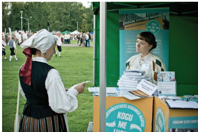
Lugude kogumine laulupeol. Gathering life stories at the Song Festival.

Kogu Me Lugu sai alguse 14. juunil 2013. aastal üleskutsena Eesti ja maailma noortele koguda oma perekonna lugu. Eesmärgiks seati mitte ainult Eesti suulise ajaloo talletamine, vaid ka selle pärandi ligipääsetavus internetis. Nii sündis Kogu Me Lugu suulise ajaloo portaal ( www.kogumelugu.ee ), mis keskendub Eesti 20. sajandi ajaloole läbi isikliku kogemuse. Selleks kogume, uurime ja jagame videoformaadis Nõukogude või Saksa okupatsiooni ajal Eestis elanud, nimetatud võimude eest Eestist põgenenud või nende tegevuse tulemusena Eestisse sattunud inimeste mälestusi (otsetunnistajad ja nende lähedased). Portaal on kasutatav eesti, inglise ja vene keeles.